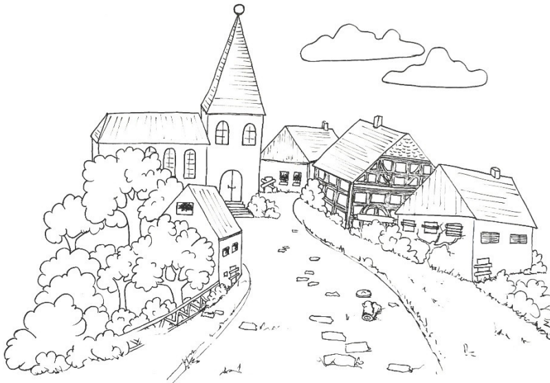
Het onbewoonde dorp

Aan het eind van die wei ligt een dorp. Omdat het op bruinkolen staat, moet het weggebaggerd worden, men wil die kolen afbouwen. Daarom zijn alle inwoners ergens anders heen verhuisd. Het dorp is leeg.